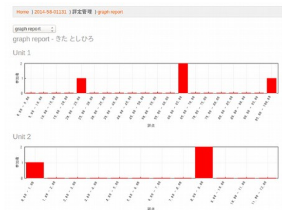
図 3: gradereport_graph アドオン

両アドオンともに、Moodle のプラグインの規格に準じて実装されているので、Moodle 本体のプログラムコードに手を入れる必要もなく、通常のアドオンのインストール手順に従えばインストールして利用可能である。quiz_wrongans アドオンは、Moodle ディレクトリの下 mod/quiz/report/ ディレクトリのところに、gradereport_graph アドオンは Moodle ディレクトリの下 grade/report ディレクトリのところに、コピーしてから、管理メニューの「通知」にアクセスするとインストールできる。